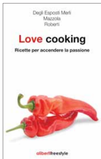
Copertina Love cooking

dei problemi quotidiani. Ingredienti fondamentali per leggere e mettere poi in pratica le proposte culinarie sono la seduzione e l'autoironia, la voglia di giocare e sperimentare. Ricette alla portata di tutti per migliorare la vita di coppia e affrontare ogni situazione con creatività e gusto. E se qualcosa va storto, le autrici ricordano che "sarà proprio l'ironia che vi aiuterà a superare l'impasse di un eventuale fiasco".