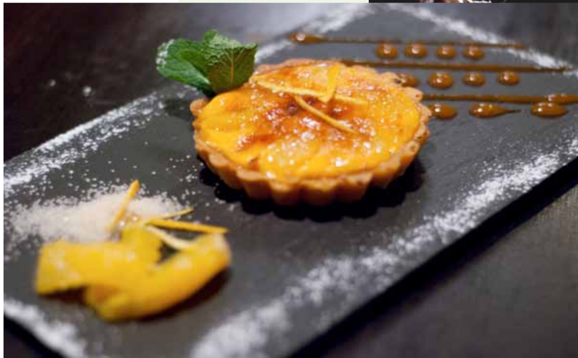
Crostatina con crema catalana all'arancia

MUSICA In un mondo vicino a quello della canzone d'autore, che si muove tra più stili, dal folk al rock, dall'elettronica al genere cameristico, Cesare Livrizzi presenta il suo album d'esordio Dall'altra parte del cielo (Zone di Musica). Come racconta lo stesso autore, "è un disco che tende la sua mano a chi voglia per un attimo immergersi in tutto quello che può dare, quando anche solo un bisbiglio che richiama l'estate può rasserenare il più buio degli inverni".