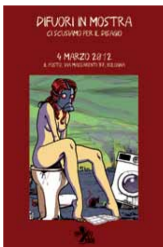
Locandina di "DIFUORI IN MOSTRA"